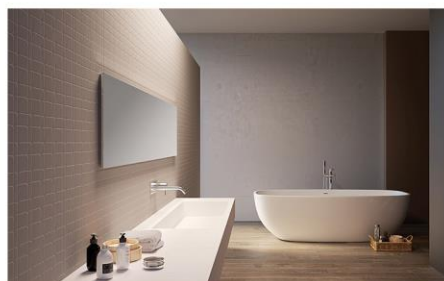
HI-MACS Structura® en diversas aplicaciones