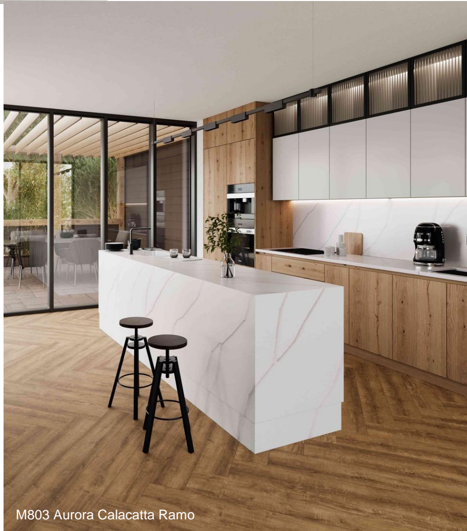
M803 Aurora Calacatta Ramo

Calacatta Ramo mantiene la elegancia latente en todos los diseños y, además, aporta un claro aire moderno inspirándose en la belleza natural del mármol de Calacatta, a través de sus cálidas vetas marrones sobre la base blanca lisa. No solo aporta una sensación de fluidez orgánica, sino que esta tonalidad es ideal para aplicar en grandes superficies, como mostradores en áreas de recepción, revestimientos de islas de cocina, superficies de trabajo, así como paredes y suelos de baños.