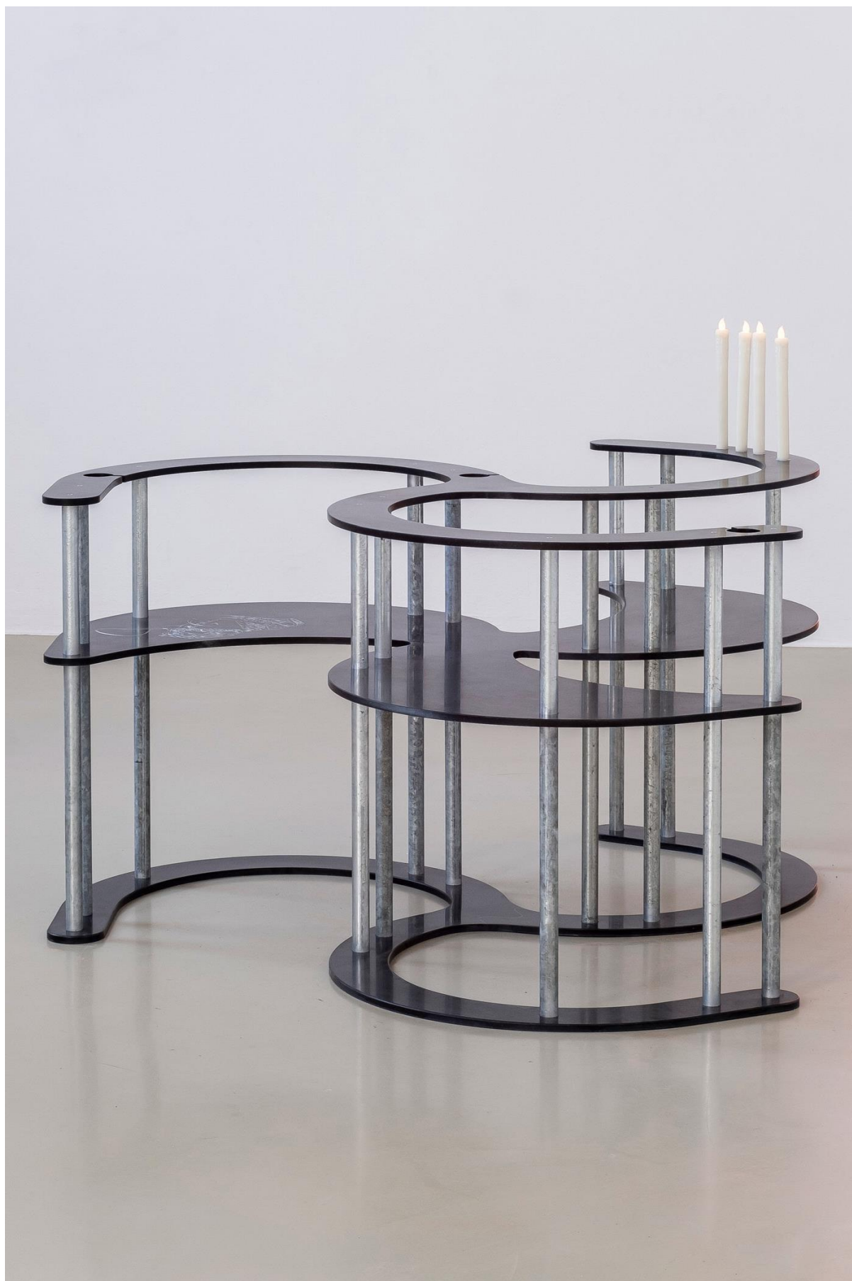
Ménage à trois , serie 2024 di Lena Marie Emrich

HIMACS Contatti media in Europa: Mariana Fredes – tel. +41 (0) 79 693 46 99 – mfredes@lxhausys.com Immagini in alta risoluzione disponibili al link: https://www.lxhausys.com/eu-it/progetti