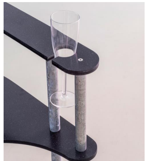
Gossip Chair (Where glorious uncertainty reigns), serie 2024 di Lena Marie Emrich che utilizza HIMACS per la serie di mobili scultorei "Talk of the Town"