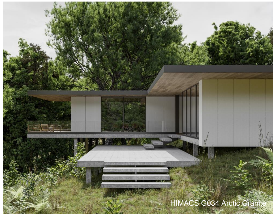
HIMACS G034 Arctic Granite