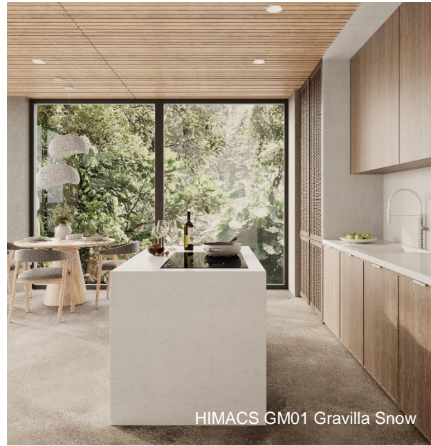
HIMACS GM01 Gravilla Snow