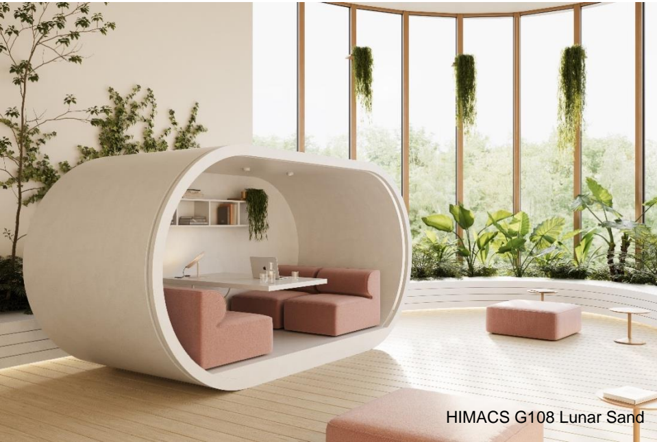
HIMACS G108 Lunar Sand