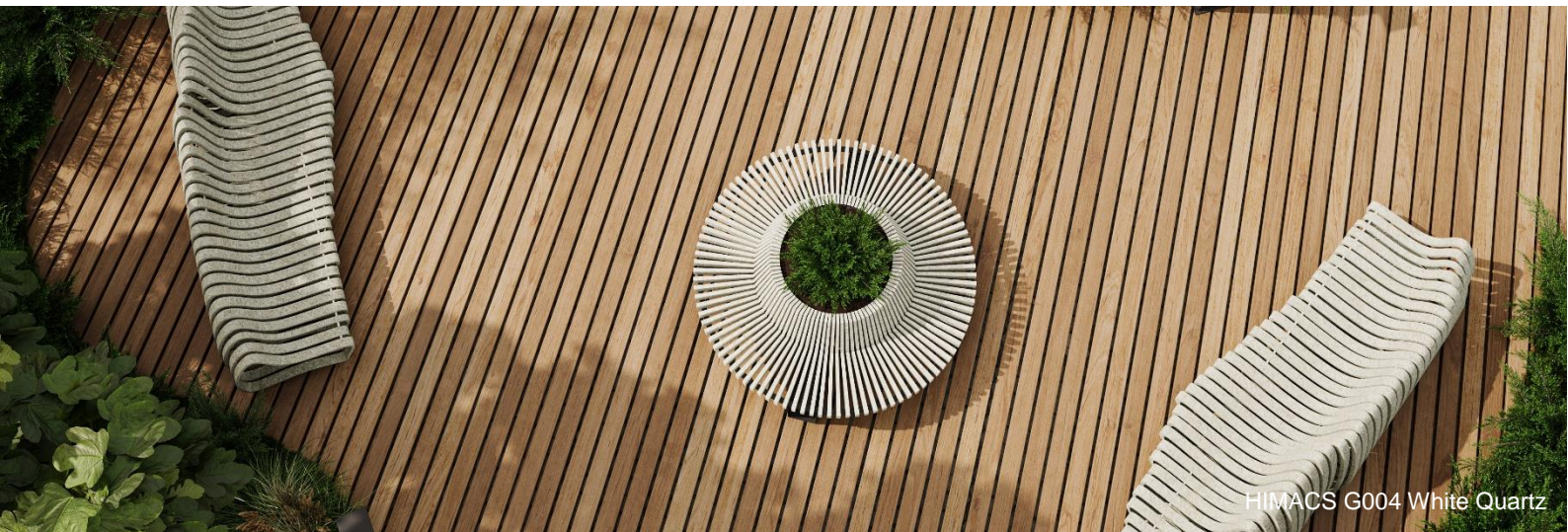
HIMACS G004 White Quartz

HIMACS Contatti media in Europa: Mariana Fredes – tel. +41 (0) 79 693 46 99 – mfredes@lxhausys.com Immagini in alta risoluzione disponibili al link: https://www.lxhausys.com/eu-it/progetti