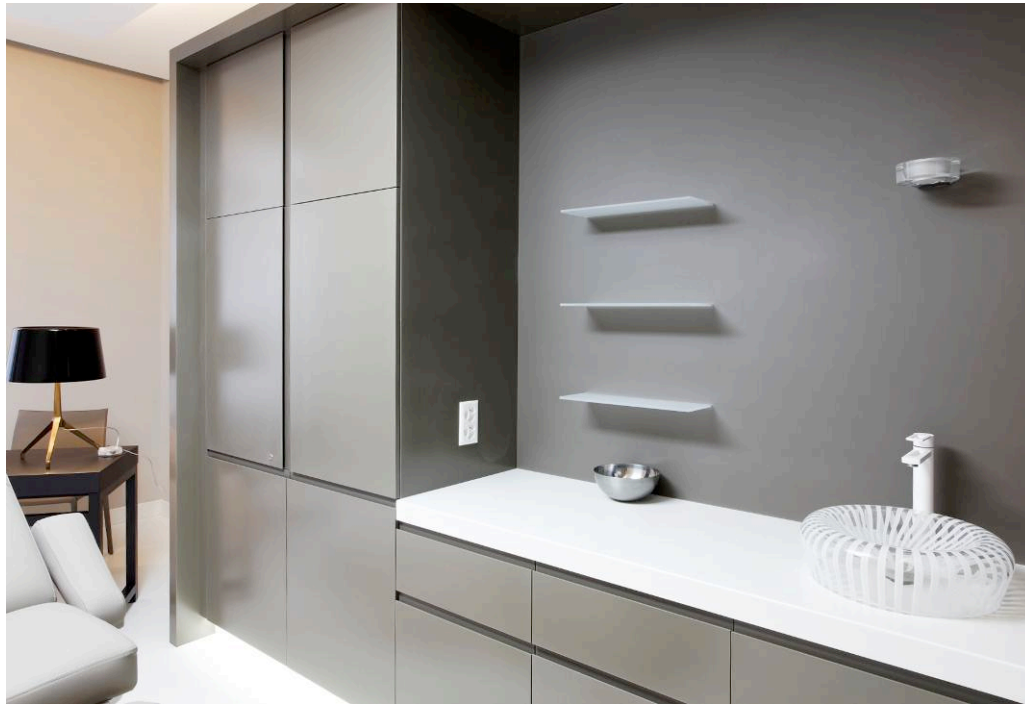
Die Wandfarbe wurde passend zu den maßgefertigten Möbeln HI-MACS® gewählt.

Jeder der Räume zeichnet sich durch eine ihm eigene Gestalt aus, mit Farben, die alle Kunden des Zentrums, sowohl Damen als auch Herren, gleichermaßen ansprechen. Alle Elemente der Inneneinrichtung erfüllen dieses Konzept. Die maßgefertigten Möbel sind vollständig mit HI-MACS® beschichtet, die Wände haben den dazu passenden Anstrich und diffuses Licht erhellt die Räume, die über unterschiedliche Badezimmer, je nach „Persönlichkeit“ des jeweiligen Raumes, verfügen. All dies sorgt für eine entspannende Atmosphäre, die mehr der eines Wellnesszentrums als eines medizinischen Instituts gleicht.