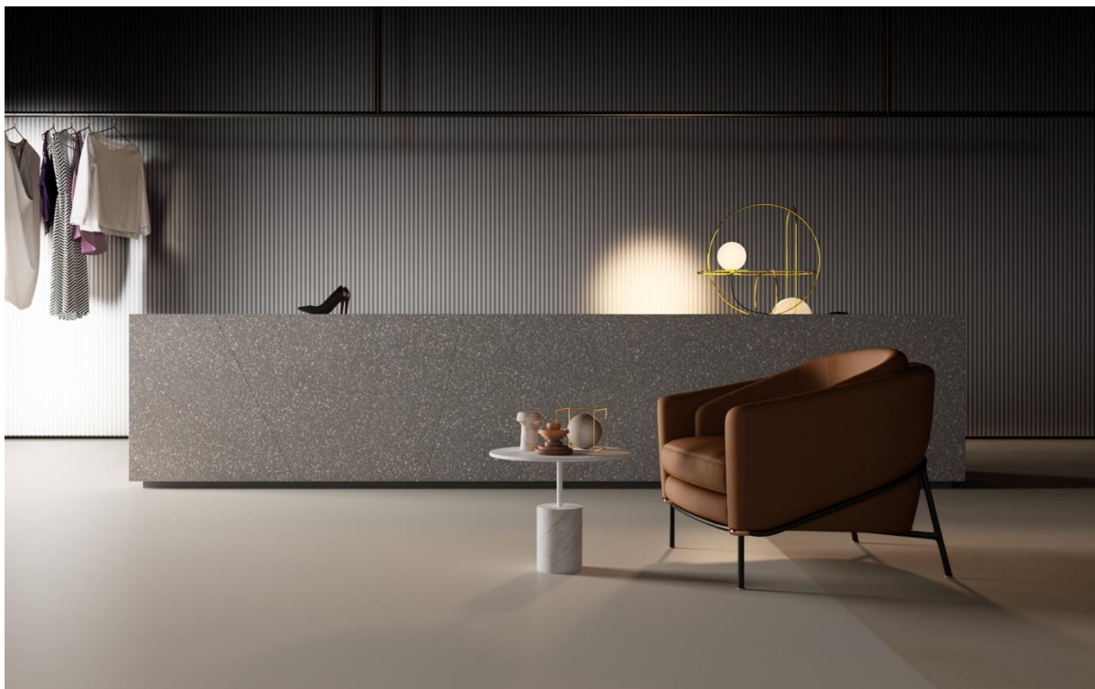
HI-MACS® TERRAZZO GRIGIO