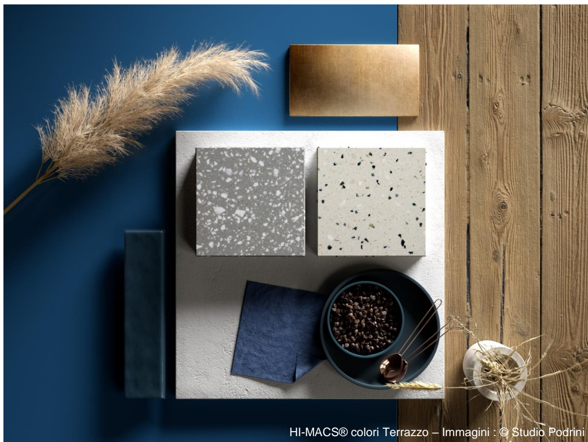
HI-MACS® colori Terrazzo – Immagini : © Studio Podrini

Parlando di tendenze in materia di superfici, c'è uno stile che ha avuto un'enorme influenza sugli interni residenziali e commerciali. Si tratta dello stile Terrazzo, che ha conquistato qualsiasi settore del design ed è sempre più spesso utilizzato per la realizzazione di pavimenti e rivestimenti.