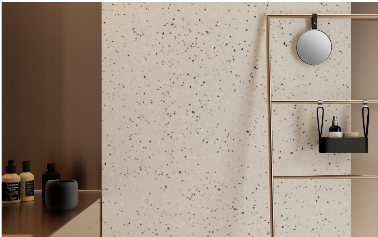
HI-MACS® TERRAZZO CLASSICO