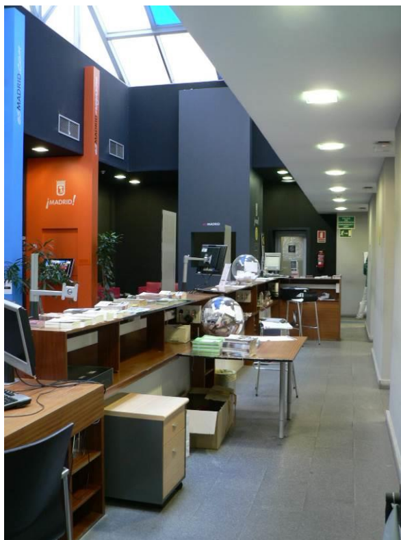
Immagine del degli spazi e della sala a volta, prima della ristrutturazione: